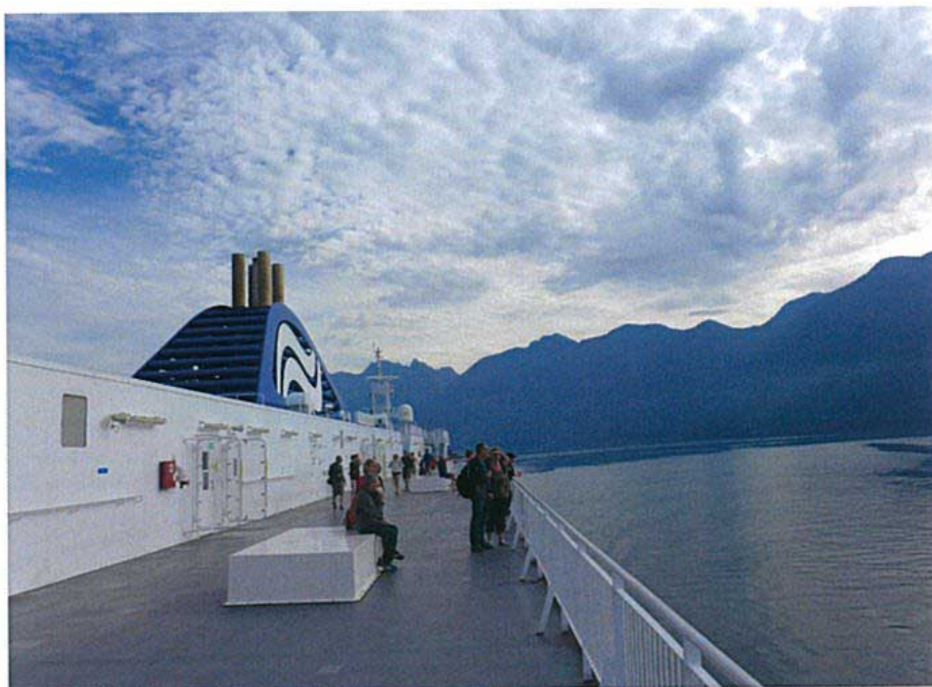
フェリーでビクトリア島に移動

成績が優秀で指定科目の単位を取得した学生はバンクーバーアイランド大学への入学が認められています。