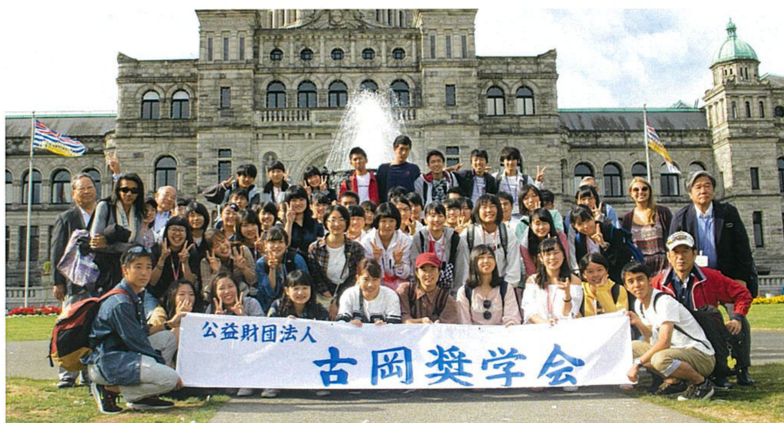
ビクトリア州議会議事堂前での記念写真

研修地： British Columbia Nanaimo (ブリティッシュ コロンビア州・ナナイモ)