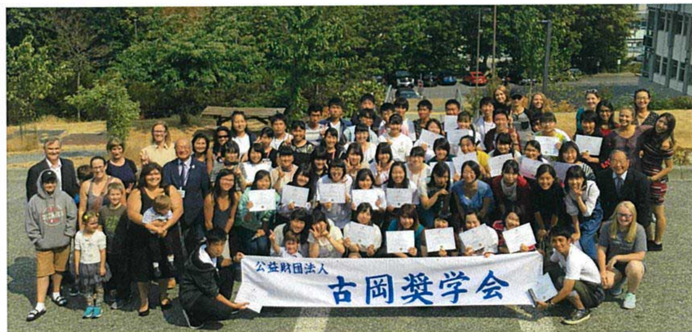
修了式を終えて、お世話になったホストファミリー、バディーとの記念写真

カヤックは全員初めての体験でしたが、講習を受けた後実際に海に出で2人で漕ぐ爽快感でカナダの夏の大自然を満喫しました。