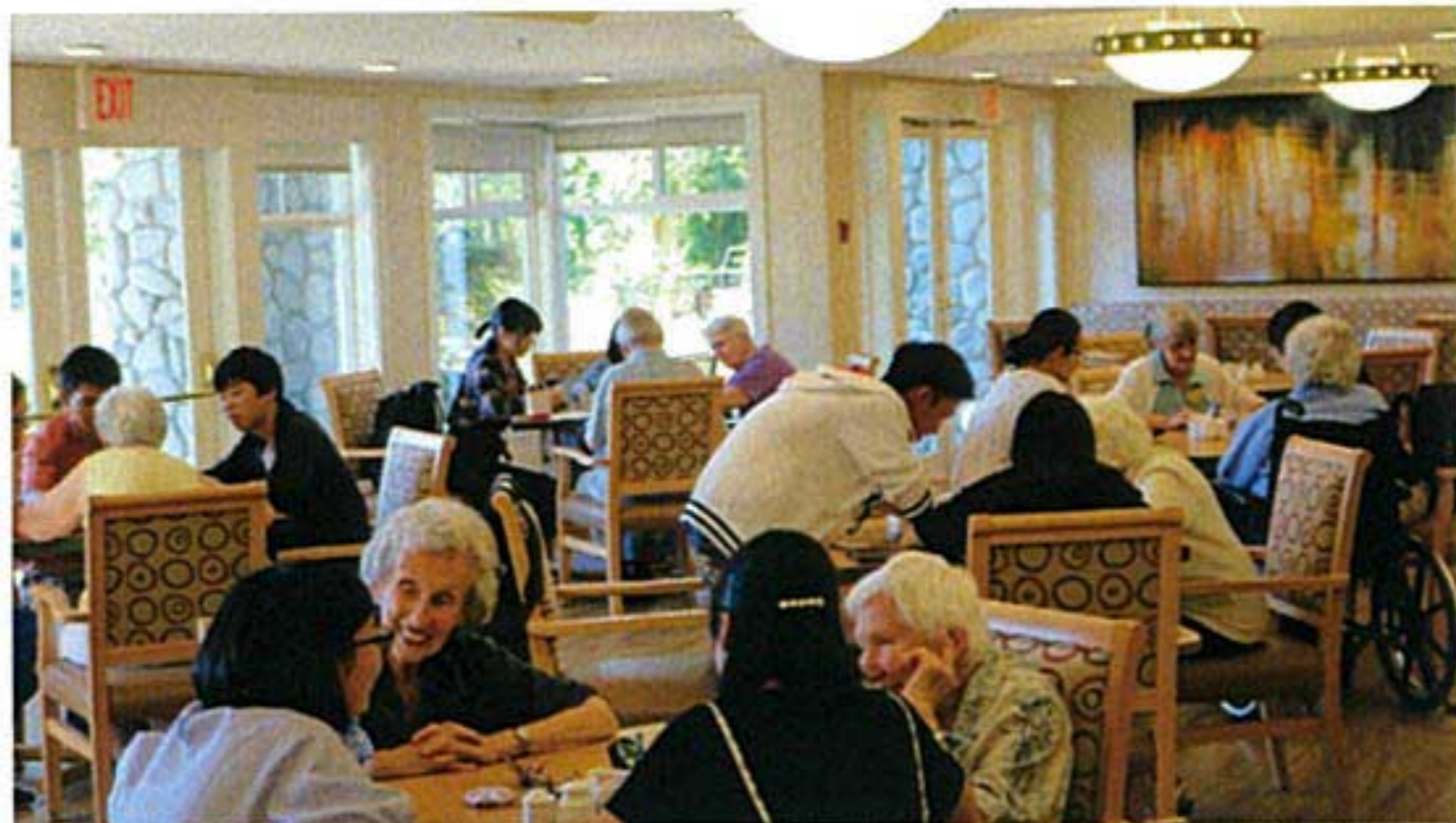
シニアハウスにて